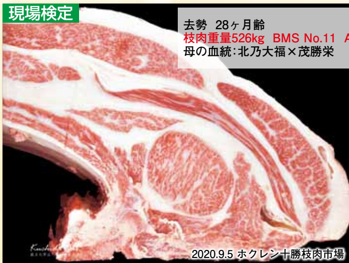
2020.9.5 ホクレン十勝枝肉市場