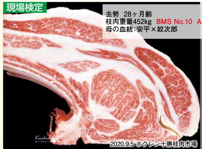
2020.9.5 ホクレン十勝枝肉市場