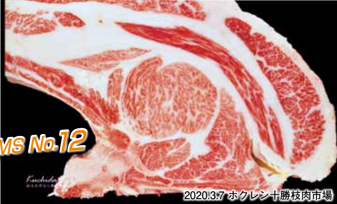
2020.3.7 ホクレン十勝枝肉市場

去勢 28.0ヶ月齢 枝肉重量530kg BMS No.12 A-5 母の血統：勝忠平×金幸