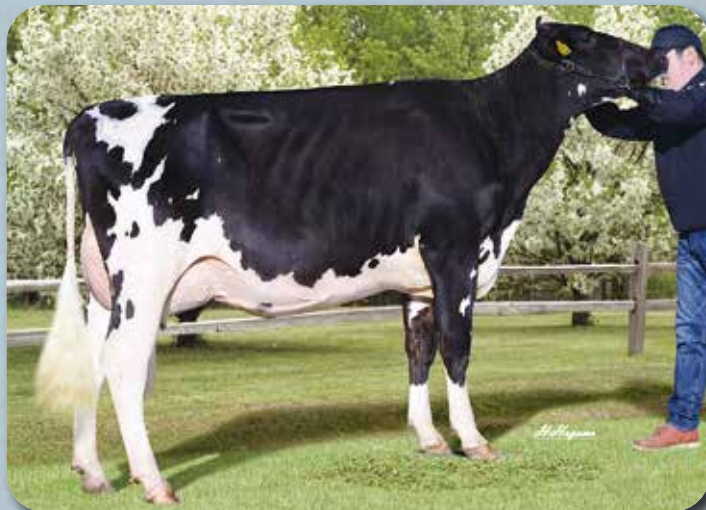
娘: ヒシヌマファーム クラモン オラホーム R4.2.27生 母の父: ソロモン 鶴居村(有)菱沼ファーム 所有

娘牛表型平均 M11,012 F447 4.08% SNF962 8.72% P370 3.35% T79.8