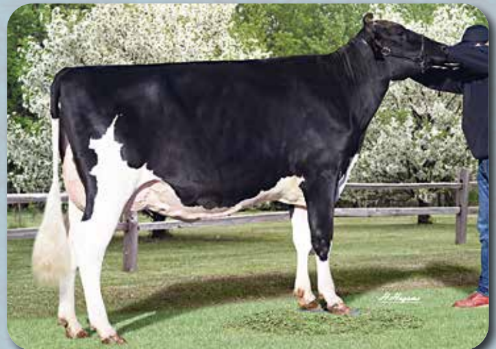
娘: ヒシヌマファーム ベツス クラウン R4.1.24生 母の父: モントレー 鶴居村(有)菱沼ファーム 所有