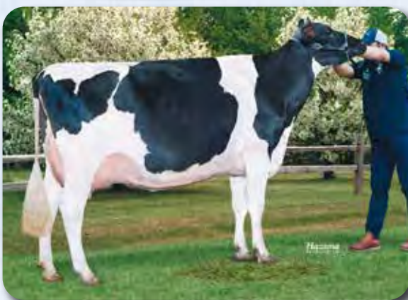
娘：M シド アリシア メーカー H30.8.26生 母の父：アレキサンダー 幕別町 田村 寛興氏 所有