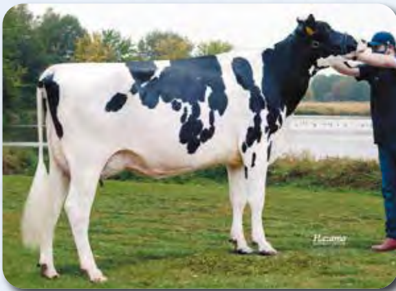
娘：クリエイター ミツキー スマック H30.9.1生 母の父：ソクラテス 鹿追町 浜口 敏成氏 所有