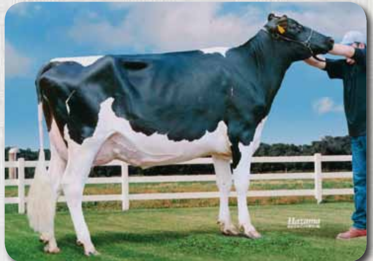
娘：マランダ チエダー ハレー GP-80 H28.11.1生 母の父：ウイスコンシン RED 清水町 西川 徳男氏 所有