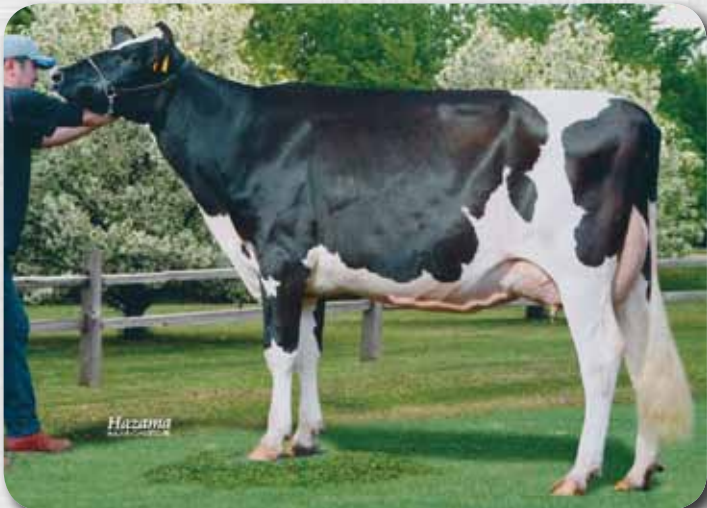
娘：クララ ファクト ブランディ GP-81 H28.10.18生 母の父：ファクト 帯広市 上田 倫章氏 所有

気質 100 搾乳性 99 在群期間 101 66%R 泌乳持続性 +2.01 80%R 体細胞スコア 1.99 Temperament Milking Speed Herd Life Lactation Persistency S.C.S