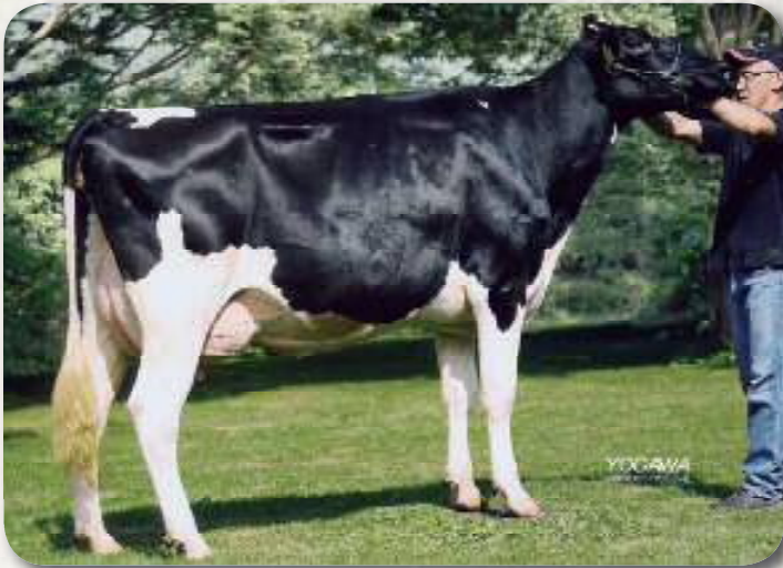
母: ベイリッチランド キューティ プラネット ET GP-84 4.08才 2X 305 M12,032 F535 4.4% P417 3.5% SNF1,078 9.0%

泌乳持続性 +0.49 78%R 体細胞スコア 2.24 Lactation Persistency S C S