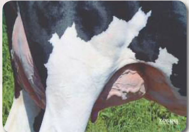
娘: レツドリバー パウエル メイファ