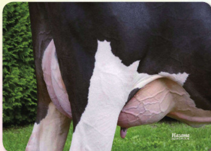
娘：TLM ウィットニー アラモード H27.6.5生 母の父：ジェスロ 帯広市(有)十勝ライブストックマネージメント 所有 第48回十勝総合畜産共進会 第9部後代検定娘牛2歳クラス 1等賞1席&ベストアダー