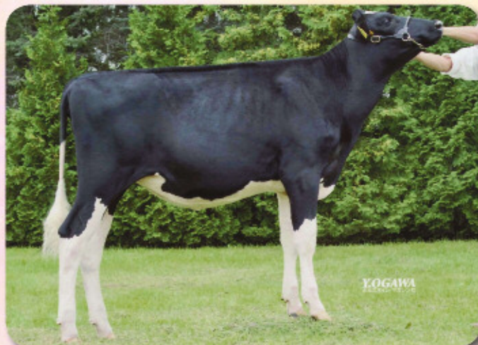
母：ハツピーリバー チャンプ モード ET EX-9D 2008北海道ホルスタインナショナルショウ 第9部シニア2歳クラス 2等賞1席 8.09才 2X 365 M14,395 F535 3.7% P422 2.9% SNF1,204 8.4%