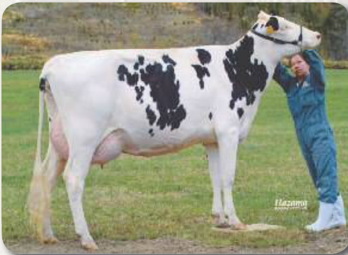
曾祖母：ヘンカシーン ブリッツ ヒラリー ET VG-87 3.07才 2X 365 M18,679 F806 4.3% P589 3.2% SNF1,607 8.6%

泌乳持続性 +2.13 72%R 体細胞スコア 1.78 Lactation Persistency S C S