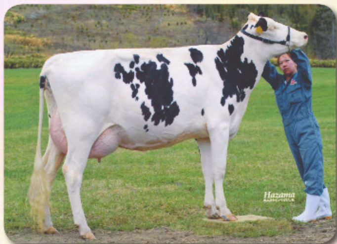
祖母：ヘンカシーンブリッツヒラリー ET VG-87 3.07才 2X 365 M18,679 F806 4.3% P589 3.2% SNF1,607 8.6%