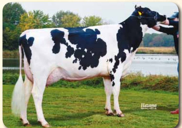
娘：インデイ ジョージア バーチ GP-81 乳器-80(2才) H25.9.20生 母の父：ガリスン 上士幌町 高橋 靖寿氏 所有