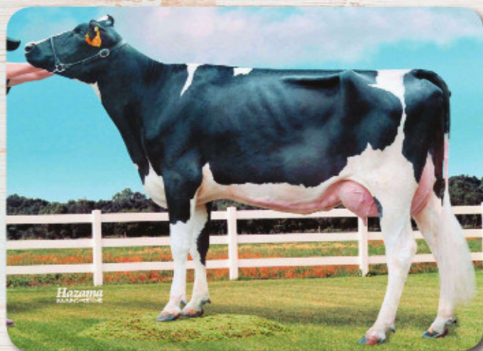
娘: セジス ファルサー サリー H24.8.23生 母の父: デュランゴ 豊頃町 鈴木 教浩氏 所有

娘牛表型平均 M10.584 F421 4.01% SNF926 8.77% P353 3.35% T79.0