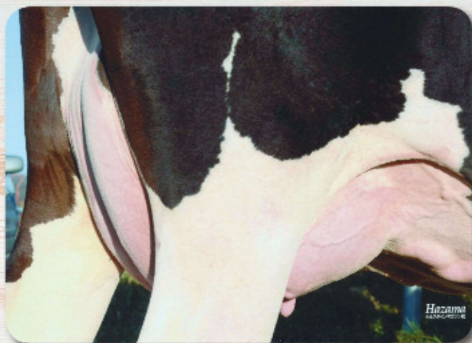
娘:エラリキヤステイング デコレット ジャマー GP-81 乳器-81 (2才) H24.1.27生 母の父:ジャマー 幕別町 岩谷 智恵氏 所有

娘牛表型平均 M10.753 F419 3.89% SNF926 8.61% P345 3.20% T77.3