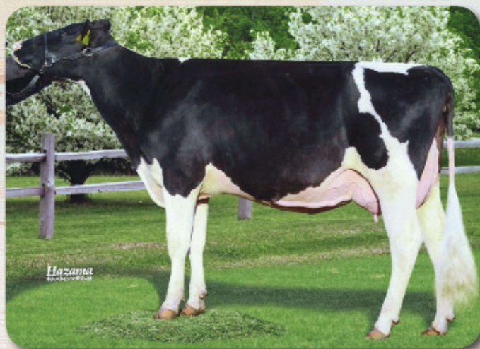
娘:ウオーカー デコレット リード H24.1.13生 幕別町 岩谷 智恵氏 所有