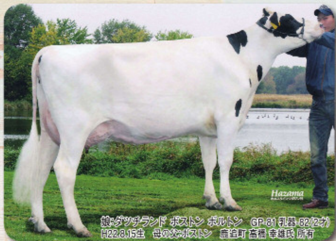
産: ダッチランド ポストン ボルトン GP-81 乳器-82(2才) H22.8.15生 母の娘ポストン 鹿追町 高橋 幸雄氏 所有