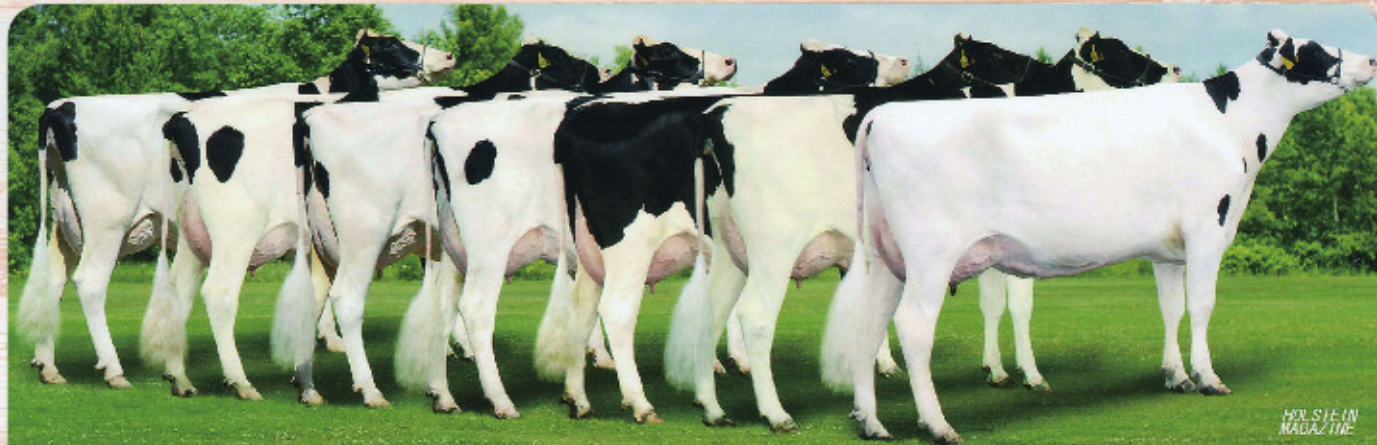
ウイスタリア ゴールデンブルジャンスキー 岩手県 藤森 雅美氏 所有 ウイスタリア ゴールデンコロンビア 岩手県 藤森 雅美氏 所有 Lハート プライド ゼニス ボルトン 浦祝町 (有) ランドハート 所有 ダッチランド ポストン ボルトン 鹿追町 高橋 幸雄氏 所有

娘牛表型平均 M10.334 F444 4.32% SNF907 8.78% P350 3.39% T79.0