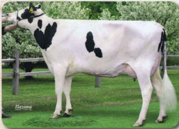
娘:コウグイス シルキア ベル GP-81 乳器-81 (2才) H22.8.29生 母の父:ジャンボリー 江別市 西純一氏 所有

157牛群 178頭 92%R 決定得点 +0.60 Final Score 体貌と骨格 +0.69 Form 肢蹄 +0.52 Feet & Legs 乳用強健性 +0.79 Daily Strength 乳器 +0.19 Mammary System 産子雑産率 6% 92%R Sire Calving Ease 娘牛雑産率 8% 92%R Daughter Calving Ease 産子死産率 5% 99%R Sire Stillbirth 娘牛死産率 4% 85%R Daughter Stillbirth 初産娘牛受胎率 33% 86%R First Calf Conception Rate 空胎日数 153日 91%R Days Open to First Calving