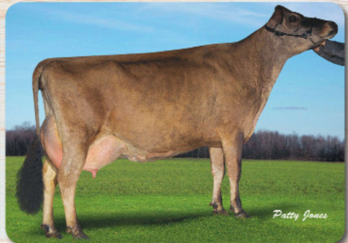
母:メープルリーフ マリブビーチ ET EX-90 4.04才 2X 305 M8,050 F374 4.65% P288 3.58%