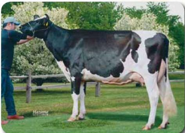
娘：クララ ファクト ブランディ GP-81 H28.10.18生 母の父:ファクト 帯広市 上田 倫章氏 所有