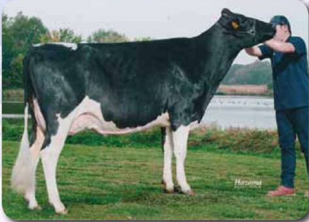
娘：エマーソン デロリアン ジエイ GP-82 乳器-82(2才) H28.3.16生 母の父:ジエイ 新得町(農)三友農場 所有