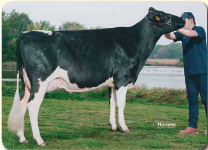
娘: エマーソン デロリアン ジエイ GP-82 乳器-82(2才) H28.3.16生 母の父:ジエイ 新得町(農)三友農場 所有