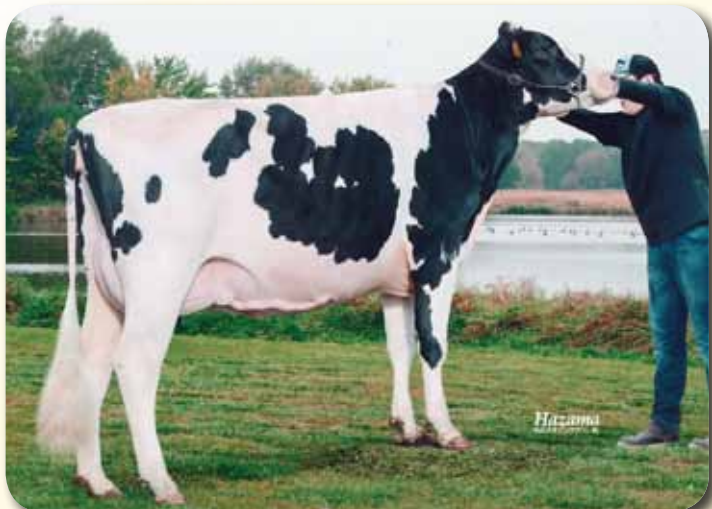
娘: バイマイ デロリアン オービット GP-82 乳器-81(2才) H28.3.1生 母の父:カデット 新得町(農)三友農場 所有

娘牛表型平均 M11,524 F456 4.00% SNF1,008 8.75% P381 3.32% T78.9