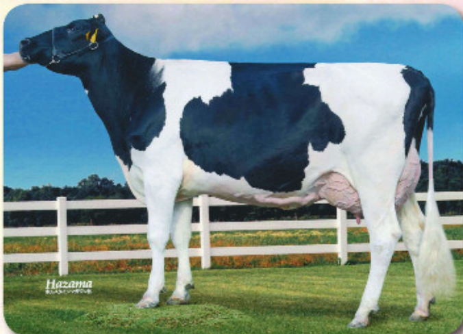
娘：マルベリー プルシヤン オーソン ゼルデン GP-80 乳器-81(2才) H23.9.13生 母の父：ミスター・サリー 士幌町 桑原 寛晃氏 所有

娘牛表型平均 M10.216 F412 4.06% SNF894 8.76% P339 3.33% T79.7