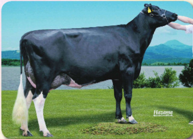
娘：エープリル ベリクレース ミツク GP-82 乳器-82(2才) H23.9.7生 母の父：ミツク 新得町(農)三友農場 所有